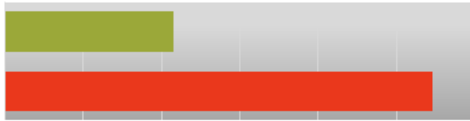
Gesamtbeitragssummen bis zum 85. Lj.

Die regelmäßige Dynamik um jeweils 5 € erfolgt tariflich ausgehend von 2018 danach alle 3 Jahre. Aus Vereinfachungsgründen erfolgt die Berechnung der Dynamik nur bis zum 70. Lebensjahr. Sie ist auch darüber hinaus weiterhin unbefristet möglich.